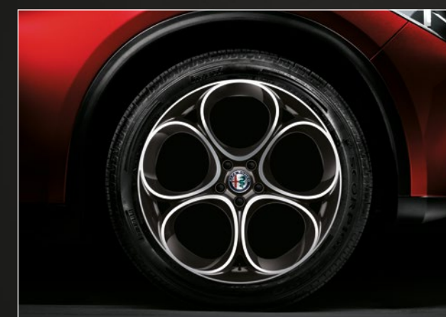
Lichtmetalen velgen '5 Petals' 20" WRD