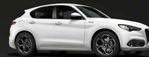
217 Bianco Alfa