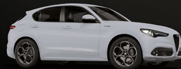
9K1 Grigio Moonlight Opaco