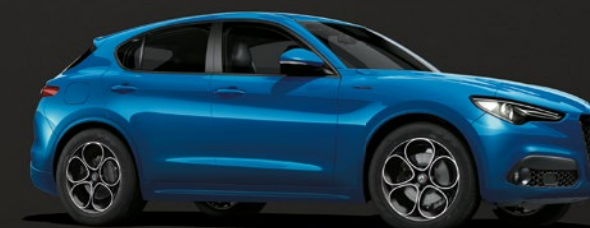
756 Blu Misano