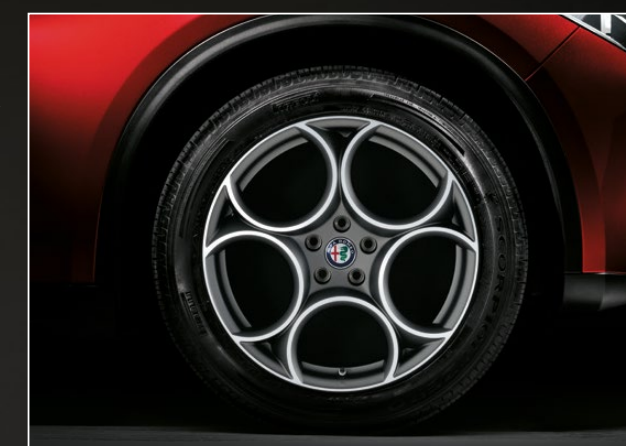
Lichtmetalen velgen 'Sport' 19" 3DY