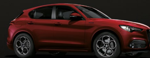
645 Rosso Etna