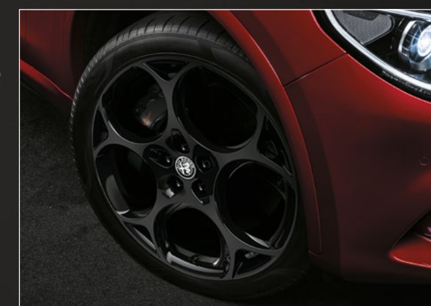
Lichtmetalen velgen 'Modale' 21" 3ET