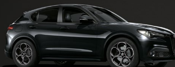
408 Nero Vulcano