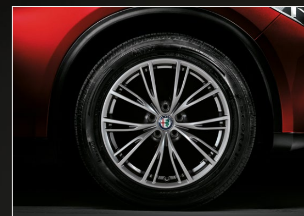
Lichtmetalen velgen 'Luxury' 18" 3DN