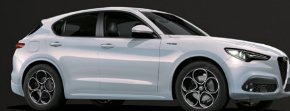
252 Grigio Moonlight