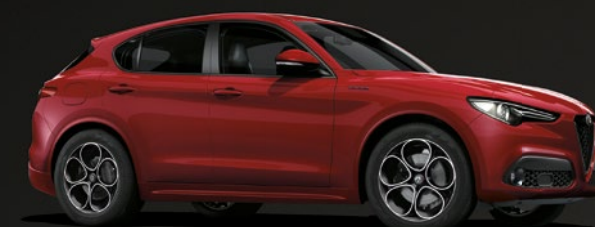
414 Rosso Alfa