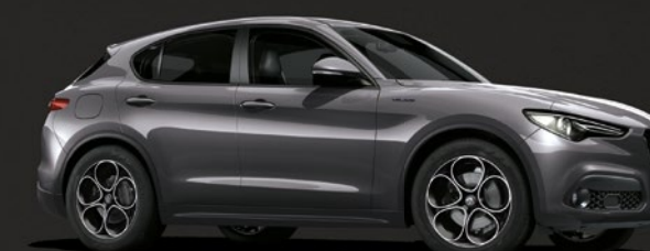
035 Grigio Vesuvio