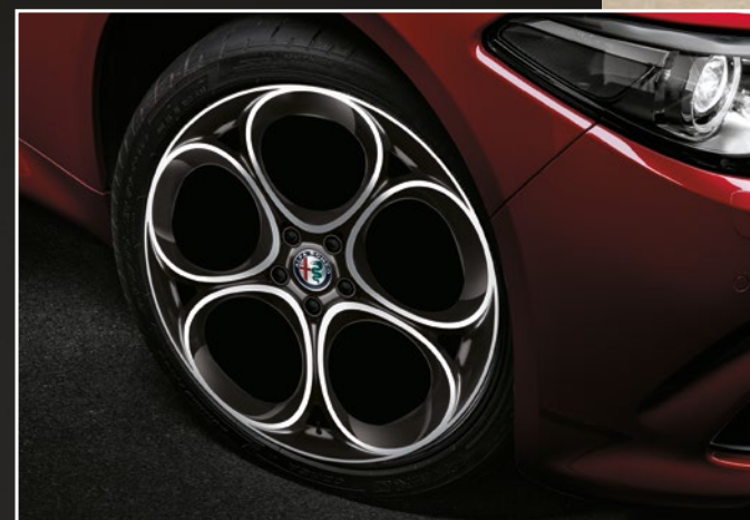
3CX Lichtmetalen velgen 19" "5 Petals"