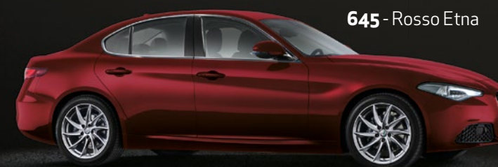
645 - Rosso Etna