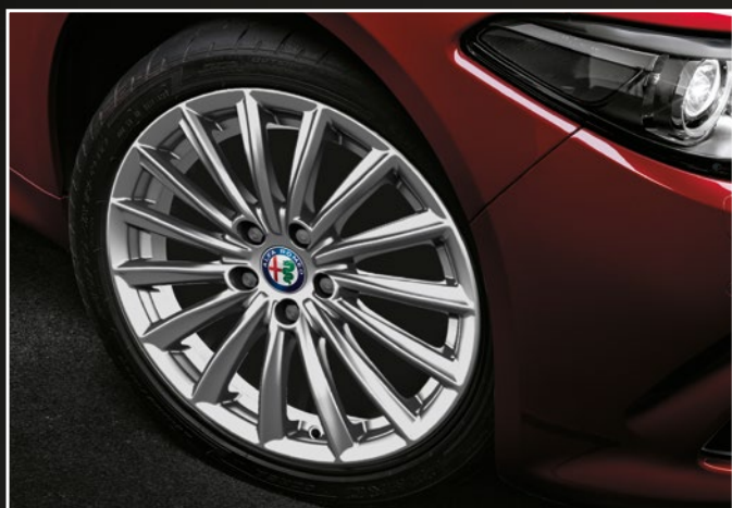
1MH Lichtmetalen velgen 17" "Luxury"