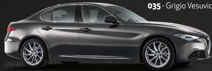
035 - Grigio Vesuvio