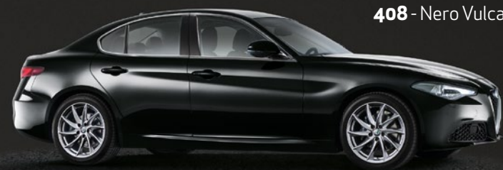
408 - Nero Vulcano