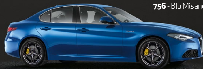
756 - Blu Misano