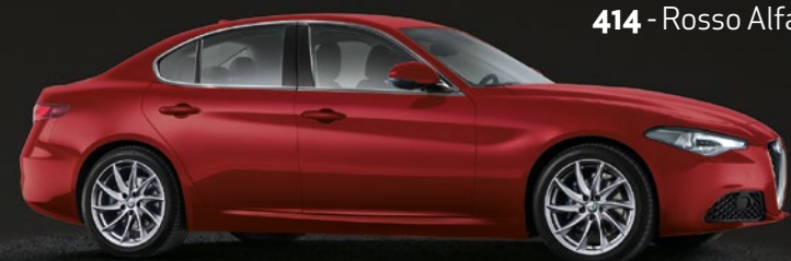
414 - Rosso Alfa