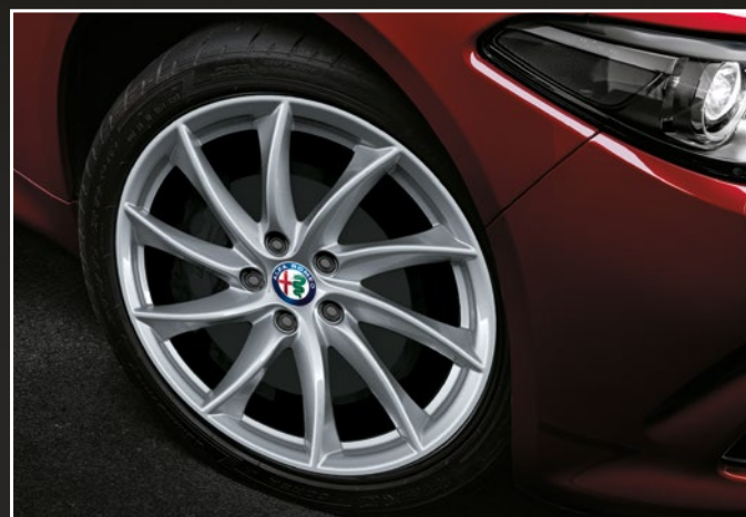
3CO Lichtmetalen velgen 18" "Veloce dark"