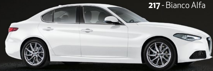
217 - Bianco Alfa