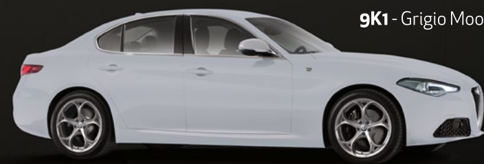
9K1 - Grigio Moonlight Opaco