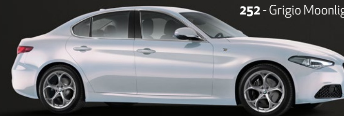
252 - Grigio Moonlight